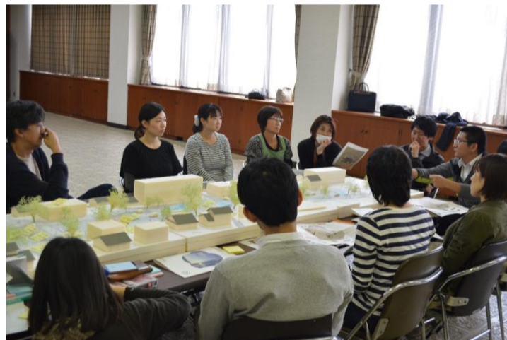
2/21の第1回目の会の風景 60名ほどの参加をいただきました